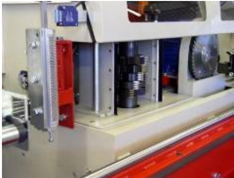
Marófej és a ragasztófelhordó fésű részlete