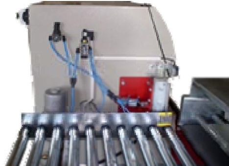
A membránszivattyú részlete