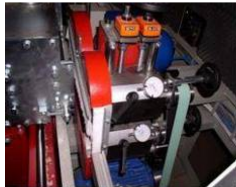
Az elővágók mikrometrikus beállítása